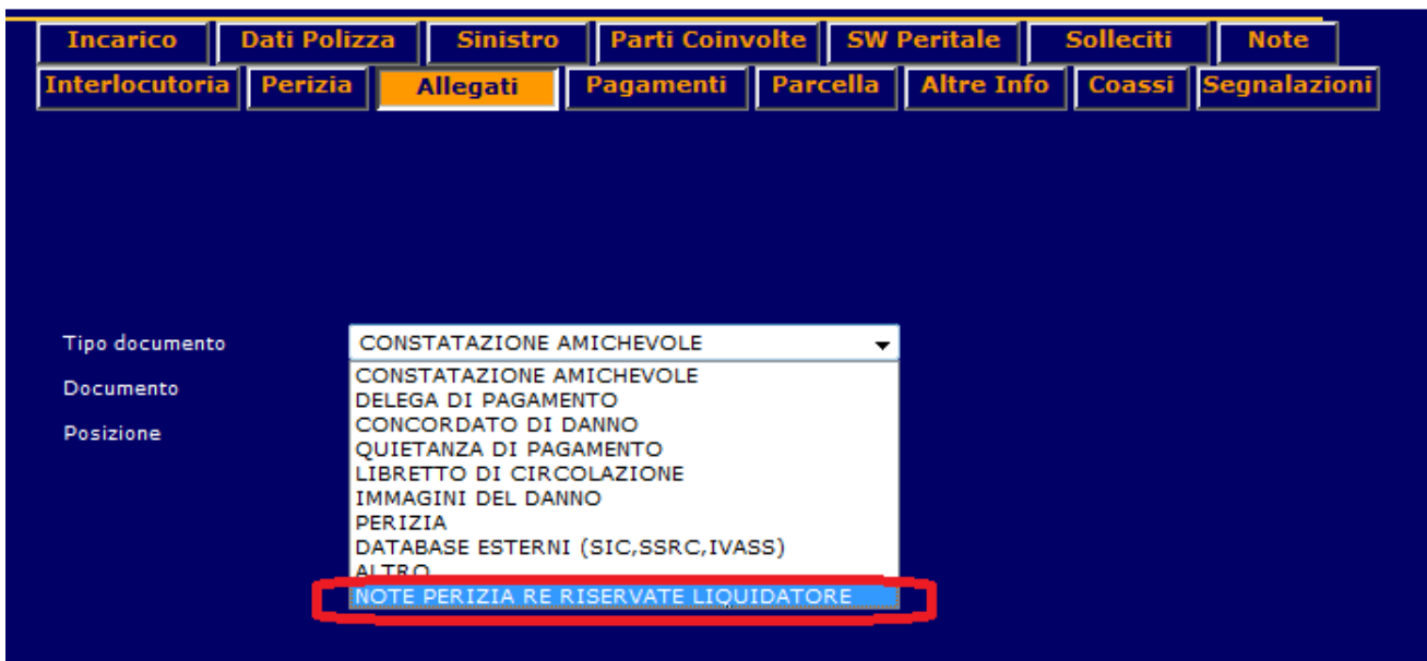
Figura 2 : TAB Allegati – Nuovo documento RE riservato per Liquidatore