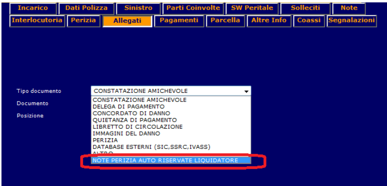
Figura 1 : TAB Allegati – Nuovo documento Auto riservato per Liquidatore