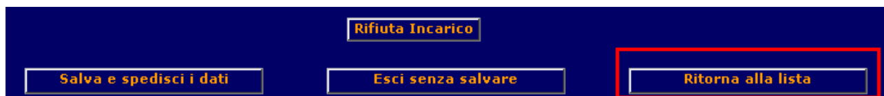
Figura 7 - Pulsante "Ritorna alla lista"

Va precisato che, come già accade per gli stati dell'incarico, utilizzando il pulsante "Ritorna alla lista", la lista incarichi avente documentazione di seguito visualizzata sarà quella derivante dalla precedente ricerca, senza le eventuali esclusioni dovute alle successive lavorazioni.