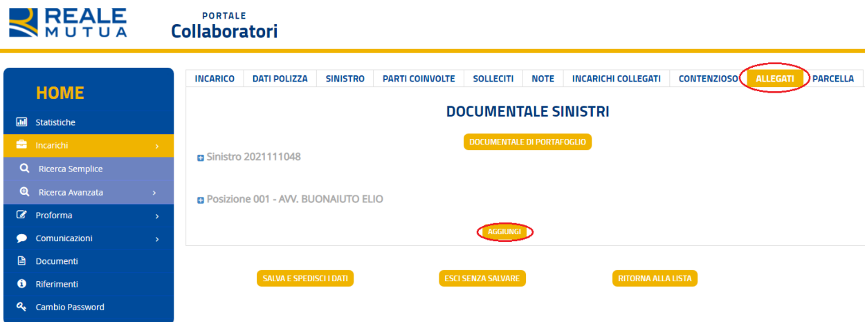
Fig. 2.1 Tab ALLEGATI.

Dall'attuale funzionalità di allega documenti previsto oggi selezionando il pulsante "AGGIUNGI" presente nel Tab "ALLEGATI" su Portale collaboratori: