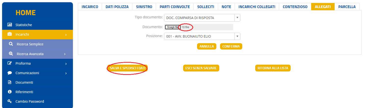
Fig. 2.4 Indicazione file allegati.