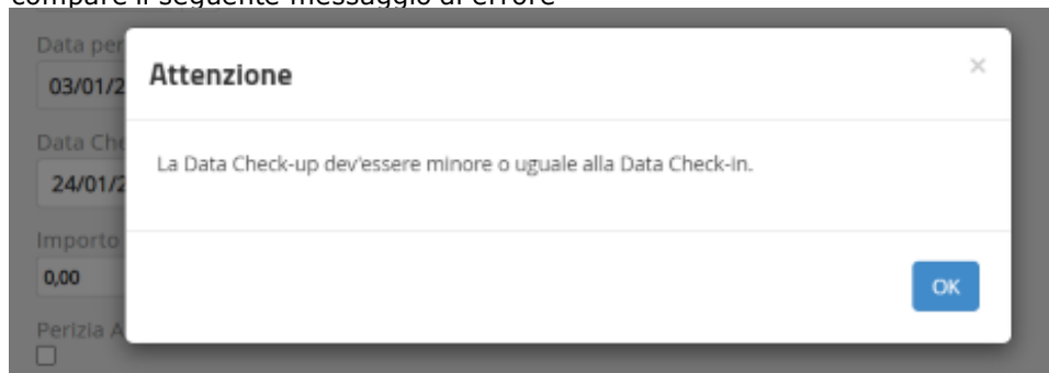
Figura5 - Errore2