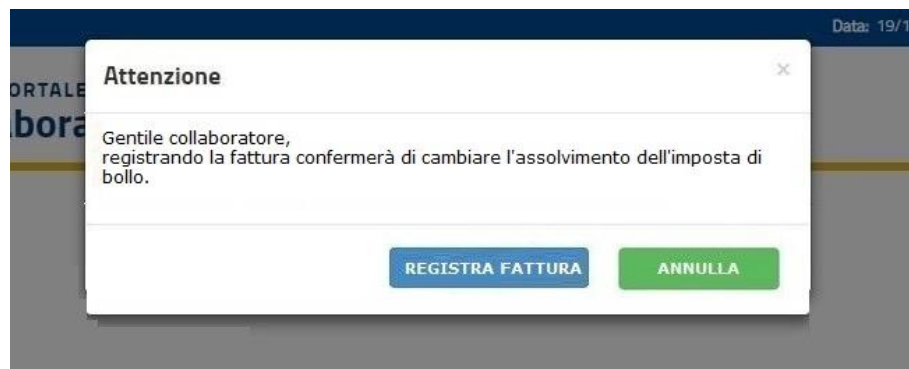
Figura 8: Conferma registra fattura

Inoltre, le stampe della fattura che vengono generate in seguito al click su REGISTRA FATTURA avranno la corrispettiva indicazione in caso di presenza di imposta di bollo (si vedano Figura 9 e Figura 10).