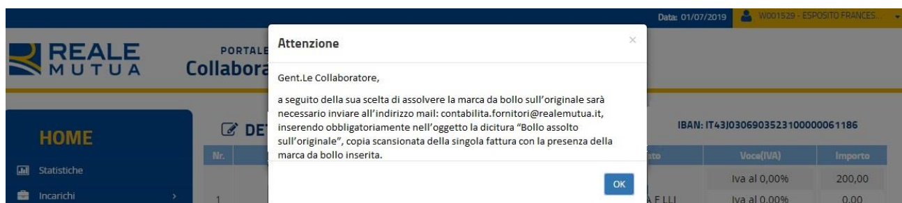
Figura 5: Popup assolvimento tramite contrassegno telematico

Nel caso in cui il collaboratore scelga l'assolvimento tramite marca da bollo, dovrà inviare alla Compagnia la copia cartacea del documento di fattura con la marca da bollo (si veda Figura 5).